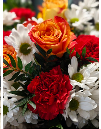
Gmina Rytwiany - www.rytwiany.com.pl/index.php?newsid=5569